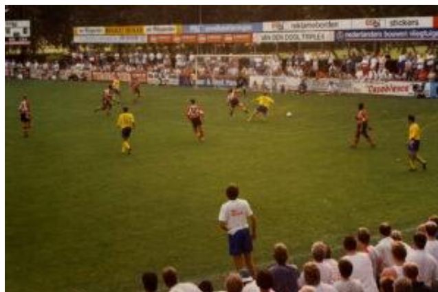
Rechterfoto: Papendrecht tegen PSV in het kader van het 75-jarig bestaan